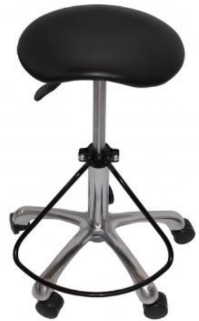
Viabel Mini Jalkatuella

16020 - Jalkatuki, leveys: 37 cm + Jalkatuen voi asentaa helposti jälkikäteen tuolia purkamatta.